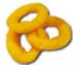
FRIED SQUID RINGS Gefrituurde inktvisringen