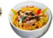
BEEF UDON Gebakken udon met bief