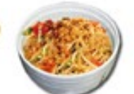
VEGGY UDON Vegetarisch gebakken udon