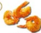
EBI FRY Gefrituurde garnalen