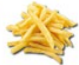
FRIED FRIES Gefrituurde friet