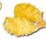
SHRIMPS CROQUETTES Garnalenkroketten