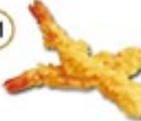
EBI TEMPURA Gebakken garnalen