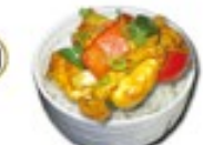
CHICKEN CURRY RICE Kipkerrie met witte rijst