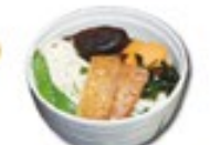
VEGGY UDONSOUF Vegetarische udonsoep