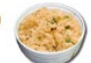
FRIED RICE Gebakken rijst