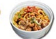
CHICKEN UDON Gebakken udon met kip